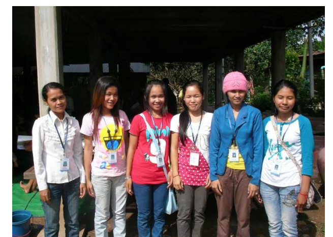
移動図書館と英語教室活動に頑張る村の女性たち